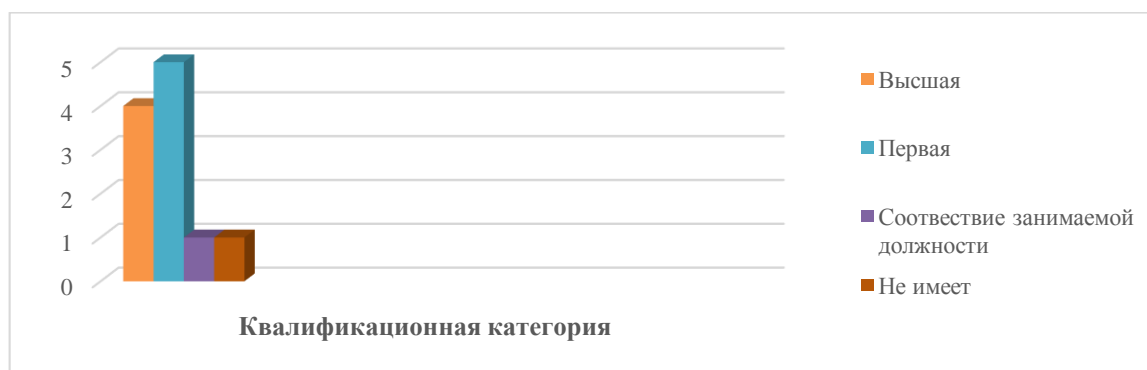
Диаграмма с характеристиками кадрового состава Детского сада.

Педагоги постоянно повышают свой профессиональный уровень, знакомятся с опытом работы своих коллег и других дошкольных учреждений, а также за счет самообразования.